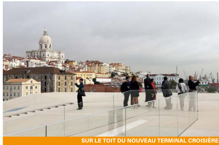
SUR LE TOIT DU NOUVEAU TERMINAL CROISIÈRE

La mission d'étude organisée les 19 et 20 octobre 2017 par l'AIVP pour ses adhérents a eu pour cadre Lisbonne, capitale du Portugal et port international dynamique. La mission avait pour but d'approfondir la question de l'intégration du port dans un territoire urbain en recomposition.