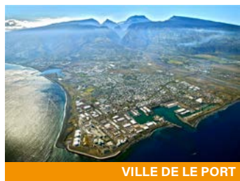
VILLE DE LE PORT

À noter que cette initiative, souhaitée par le Conseil d'administration de l'AIVP, a aussi pour finalité de poursuivre la dynamique régionale mise en œuvre pendant 6 ans par l'OVPOI (Observatoire Ville Port Océan Indien, dissout en septembre 2016). À cet égard, la mise en ligne d'un nouveau site internet dédié à ce groupe régional constitue une nouvelle plateforme d'échanges sur les enjeux ville-port régionaux. Le changement de