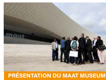
PRÉSENTATION DU MAAT MUSEUM

Retrouvez les interventions et le reportage photo AIVP sur : www.aivp.org (Actus AIVP)