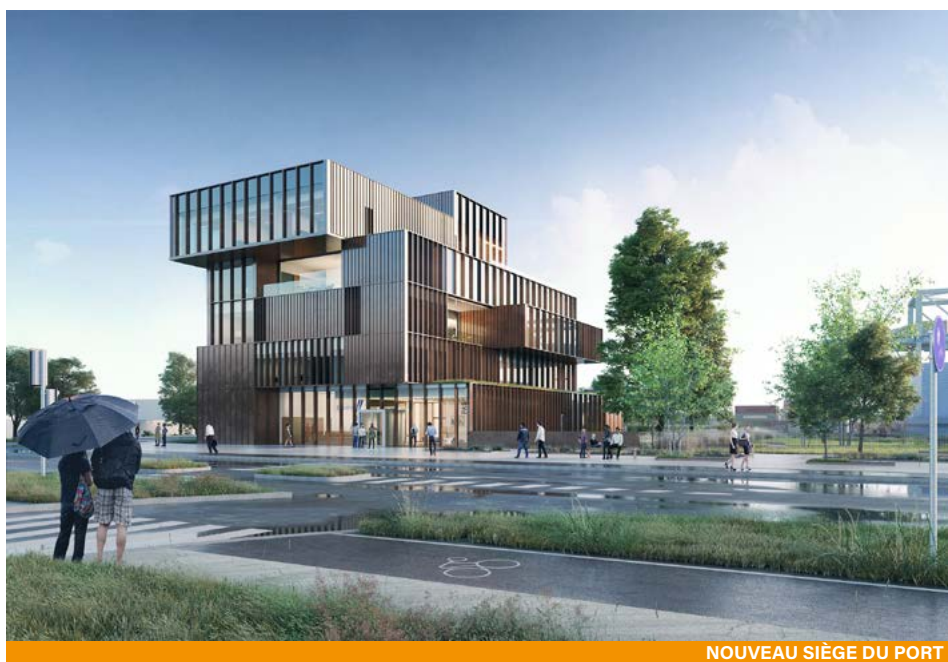
NOUVEAU SIÈGE DU PORT

Le PAS est aussi engagé dans le cadre de sa coopération Upper Rhine Ports avec 8 autres ports français, allemands et suisses dans la